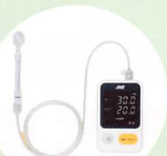
JMS舌圧測定器 TPM-02 管理医療機器 22200BZX00758000