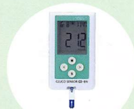
グルコセンサーGS-II N 一般医療機器 特定保守管理医療機器 13B1X00155000311