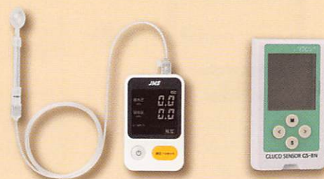
舌圧測定器 JMS舌圧測定器 TPM-02 管理医療機器 22200BZX00758000